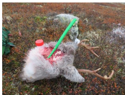
Uttak av CWD prøve

I alt fire hjerneprøver er tatt ut for CWD undersøkelse – alle negative.