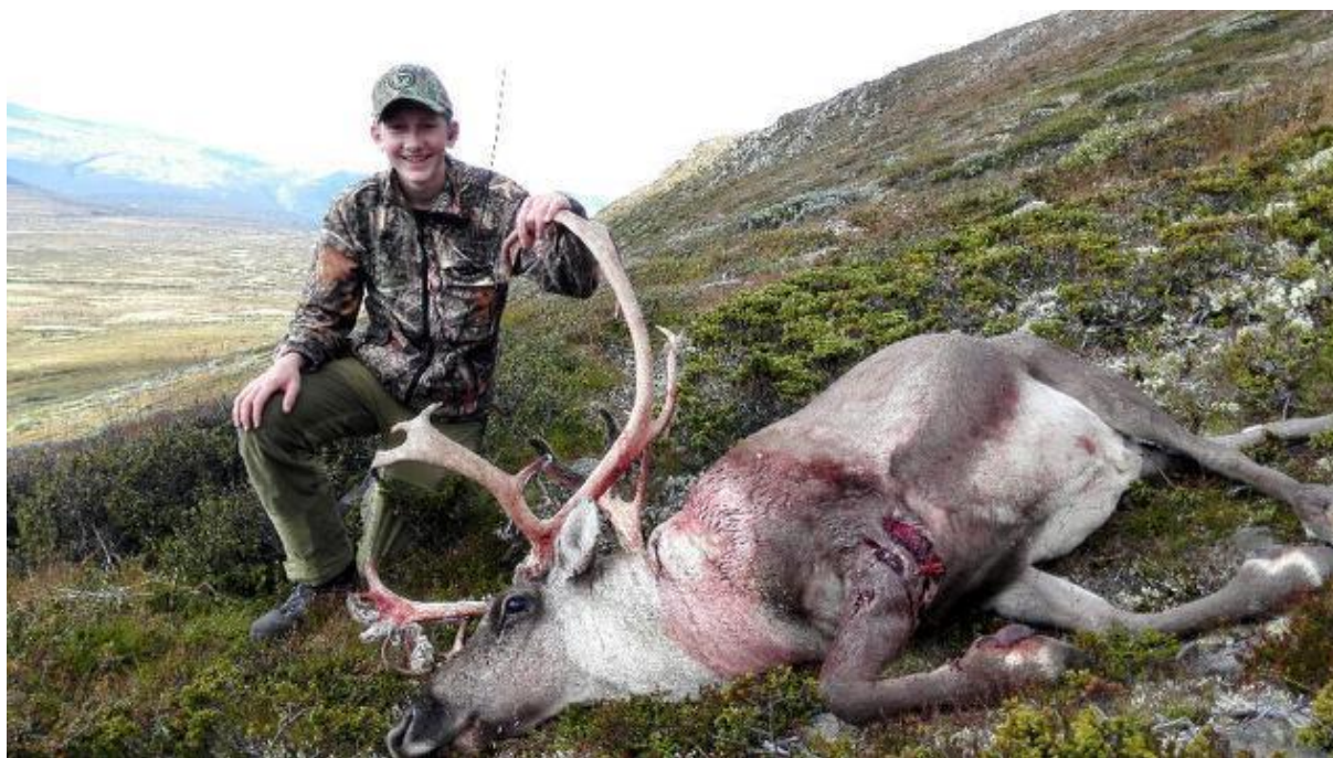
Lykkelig førstegangsjeger