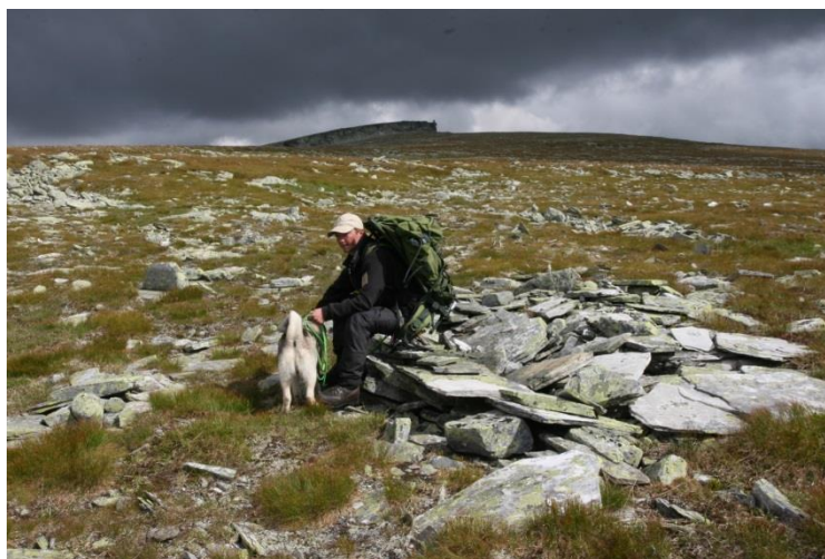
Massefangstanlegg på Bløyvangen

Jaktopplegg med forbud mot bruk av sikringsradio/jaktradio under jakt, og at simle og kalvekortene blir tildelt samlet, fører til rolige reinsflokker og fin jakt.